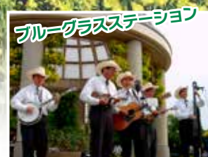
ブルーグラスステーション