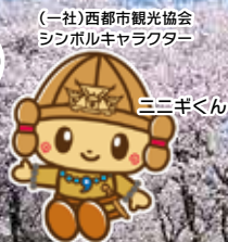
(一社)西都市観光協会 シンボルキャラクター