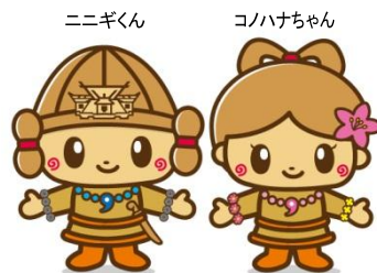
西都市観光協会シンボルキャラクター

この講座は、観光ボランティアガイドや市の文化財係によるガイドを聞きながら、西都のさまざまな観光地を巡ります。毎週参加することが困難な方は、参加できる講座の受講だけで構いません。この機会に有名どころから隠れスポットまで西都の魅力を知りつくしましょう！！